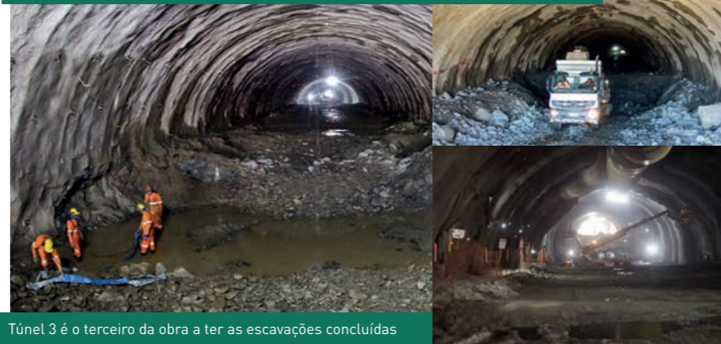
Túnel 3 é o terceiro da obra a ter as escavações concluídas

A Arteris Litoral Sul registrou mais um marco no avanço das obras do Contorno Viário de Florianópolis, a conclusão da escavação subterrânea das duas pistas do túnel 3, em Palhoça. Esse é o terceiro dispositivo da obra a registrar esse marco. A partir de agora os trabalhos seguem para a fase de escavação do rebaixo e revestimento do túnel, que permitirão a pavimentação e a instalação dos sistemas de ventilação, sinalização e monitoramento.