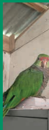
Espécie é ameaça de extinção

Ela explica que o papagaio-de-peito-roxo é uma espécie considerada em risco de extinção pela União Internacional para a Conservação da Natureza (IUCN) e supõe-se que o espécime encontrado no canteiro de obras no Contorno Viário de Florianópolis tenha sido vítima de tráfico de animais silvestres.