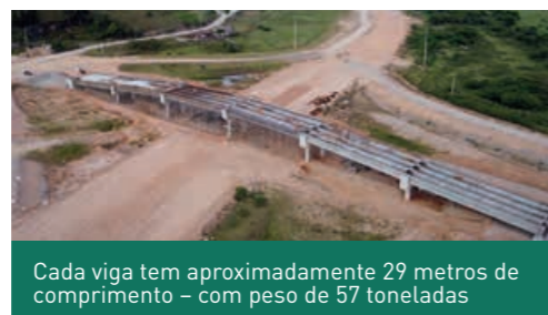
Cada viga tem aproximadamente 29 metros de comprimento – com peso de 57 toneladas

Ao todo, o Contorno conta com 20 passagens em desnível como essa (superior ou inferior). O objetivo dessas estruturas é possibilitar a continuidade da travessia do trânsito entre os bairros – sem interferência do Contorno destinado ao fluxo de longa distância.