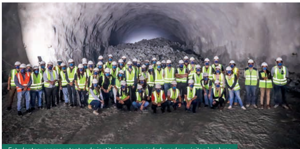
Estudantes, representantes de instituições e sociedade podem visitar às obras

O Programa de Visitas às Obras do Contorno Viário de Florianópolis, vinculado ao Programa de Comunicação Social, recebeu, desde a sua estreia, em 2017, 638 visitantes. Apenas em 2022, foram 466 pessoas que conheceram a maior obra de infraestrutura rodoviária em andamento no Brasil. Elas foram distribuídas em 20 visitas, e representaram 25 instituições, além daqueles que tiveram interesse próprio.