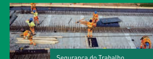
Segurança do Trabalho é prioridade da Arteris Litoral Sul

importância do trabalho conjunto. “O alinhamento das gerências das empreiteiras aos preceitos e pilares da Arteris contribuem muito para alcançarmos esse resultado tão expressivo, e seguimos juntos para mantê-lo, sempre focando na marca de acidente zero”, comenta.