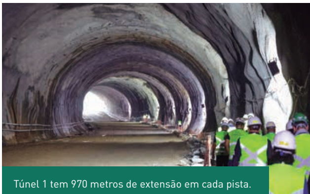
Túnel 1 tem 970 metros de extensão em cada pista.

O Contorno Viário conta com a construção simultânea de quatro túneis duplos, e o túnel 1 é o maior deles, com 970 metros de extensão em cada pista, altura variada de 10 a 12 metros, e 15 metros de largura. Esse dispositivo tem duas faixas de rolamento, acostamento e rotas de fuga para pedestres. Além disso, ele tem uma particularidade, que é o fato de ser em curva, o que traz um desafio ainda maior em relação à topografia, já que é preciso fazer com que os túneis se interliguem sem desvio.