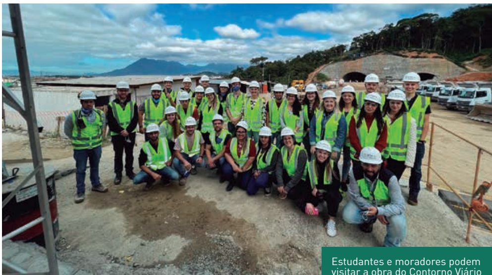
Estudantes e moradores podem visitar a obra do Contorno Viário

No mês de julho, mais duas turmas de estudantes tiveram a oportunidade de conhecer de perto as obras do Contorno Viário. A primeira delas foi composta por alunos de engenharia do Instituto Federal de Santa Catarina (IFSC), que participaram de uma palestra sobre gestão ambiental, ministrada pela equipe do Contorno, e em seguida fizeram uma visita técnica ao canteiro de obras, com parada no emboque norte do Túnel 1.