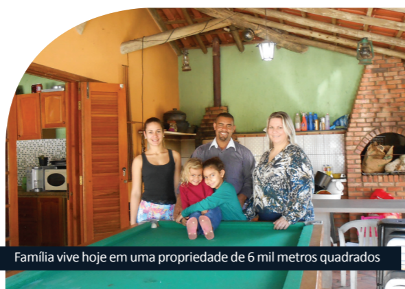
Família vive hoje em uma propriedade de 6 mil metros quadrados

Mais de 500 propriedades serão cortadas pelo traçado do Contorno Rodoviário. Em alguns casos, a propriedade não precisa ser totalmente adquirida pela concessionária, apenas a parte que será utilizada para a construção da rodovia ou como faixa de domínio. Muitos proprietários vendem essa parte para a concessionária e continuam vivendo no restante do local.