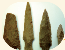
Ponta de lança