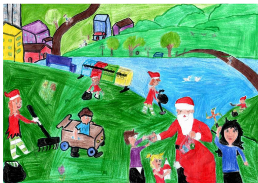
Desenho de Carla Caroline Teixeira