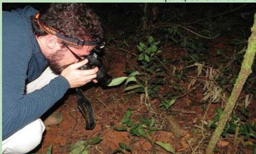
Equipe técnica ambiental registra cascavel durante levantamento de fauna, parte do EIA RIMA, no trecho a ser duplicado

“Todas essas exigências dão segurança para a comunidade do entorno e sociedade no geral