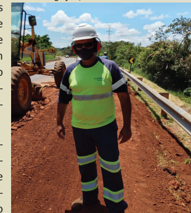
Antes de ir para a rodovia, funcionários passam por treinamentos de segurança