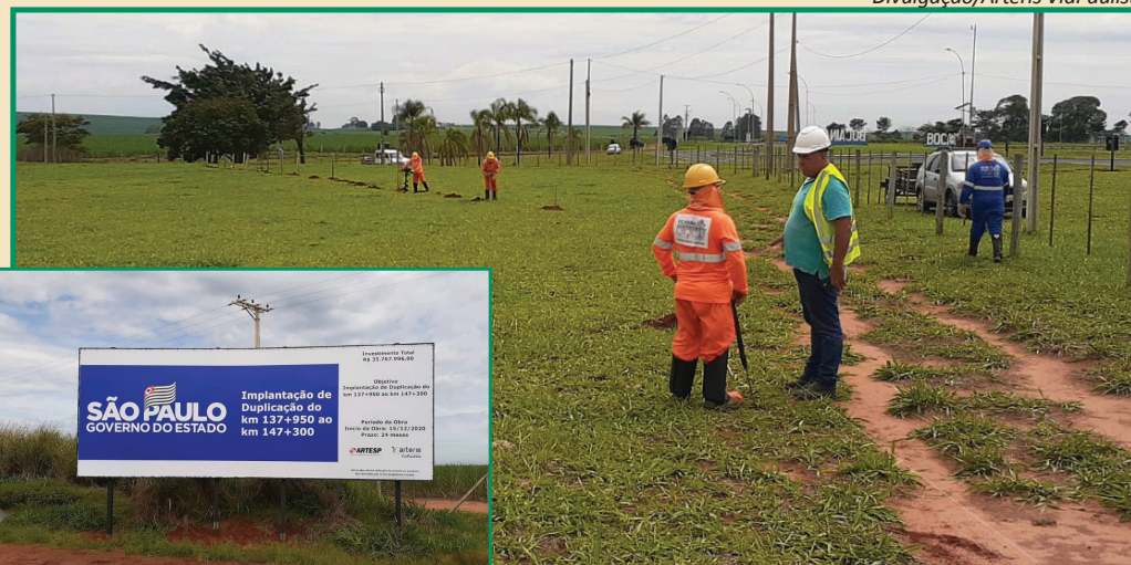
Mudança de cerca delimitadora da faixa de domínio, limpeza de área e instalação de placas e sinalizações preparam trecho para a obra

A Arteris ViaPaulista inicia uma importante etapa do processo de modernização da Rodovia dos Calçados. Vai começar em 2021 a obra de duplicação da Rodovia Comandante João Ribeiro de Barros, a SP-255. As primeiras intervenções serão no trecho do km 137,95 ao km 147,30, que liga os municípios de Bocaina e Jahu.