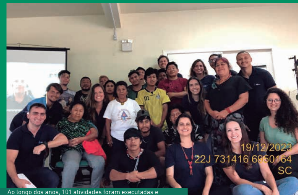
Ao longo dos anos, 101 atividades foram executadas e aprovadas em cada uma das 10 terras indígenas envolvidas

No mês de dezembro, o Componente Indígena do Plano Básico Ambiental (CI-PBA) do Contorno Viário de Florianópolis teve um importante marco, que foi a realização da 12ª reunião do Comitê Gestor, a última do Programa.