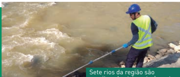
Sete rios da região são monitorados trimestralmente

Entre os 13 Programas Ambientais executados no Contorno Viário da Grande Florianópolis, um deles é o Programa de Controle, Monitoramento e Mitigação de Impactos nos Recursos Hídricos. Essa iniciativa visa avaliar o impacto das obras de construção da rodovia sobre a qualidade das águas da região através de uma seleção de variáveis físico-químicas e biológicas que deem segurança aos procedimentos de análise.