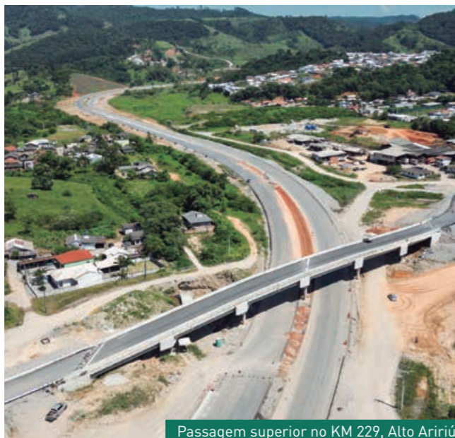
Passagem superior no KM 229, Alto Aririú

Após a liberação das passagens superiores, ficou estritamente proibido trânsito da comunidade local pelas áreas do canteiro de obras. Para garantir a segurança de motoristas, pedestres e trabalhadores, toda a via é monitorada.