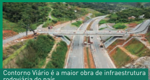
Contorno Viário é a maior obra de infraestrutura rodoviária do país

o equivalente a construção de 183 campos de futebol. As áreas das obras de arte especiais são o equivalente a 11 campos de futebol. As perfurações de geodreno e fundação equivalem a distância de Florianópolis até o estado do Amapá, em linha reta.