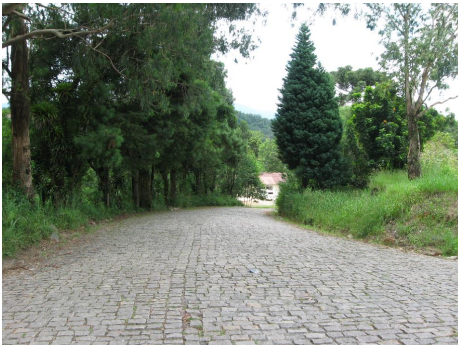
Vista da entrada ao bairro

O Povoado Ribeirão, que pertence ao município de Campina Grande do Sul, possui um dos acessos pela pista sul da BR-116, através de uma estrada de terra. Conta com aproximadamente 12 ruas, sendo todas de terra. As construções iniciam próximo às rodovias, bem próximas uma das outras, com grandes trechos de mata.