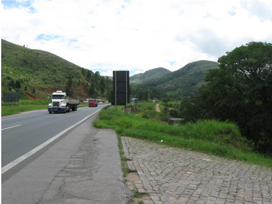
Vista da aproximação do acesso