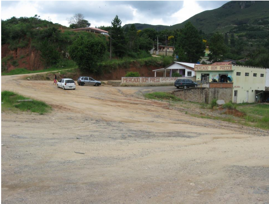
Comércio local, junto à rodovia