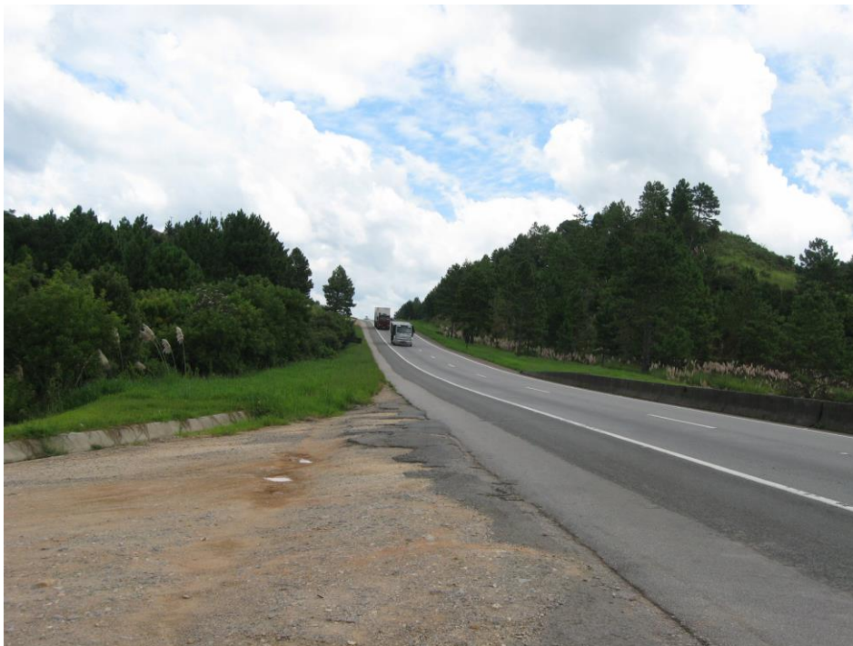
Vista da aproximação do acesso

O bairro de Jaguatirica é bastante extenso territorialmente e dispõe de diversos acessos. Possui um pequeno aglomerado urbano com 2 escolas (Escola Municipal Marechal Humberto de Alencar Castelo Branco e Escola Rural Municipal Jaguatirica), Posto Médico e pequeno comércio. No mais, construções bem espalhadas, na sua maioria voltadas para as atividades de ecoturismo. A seguir fotos do acesso em estudo.