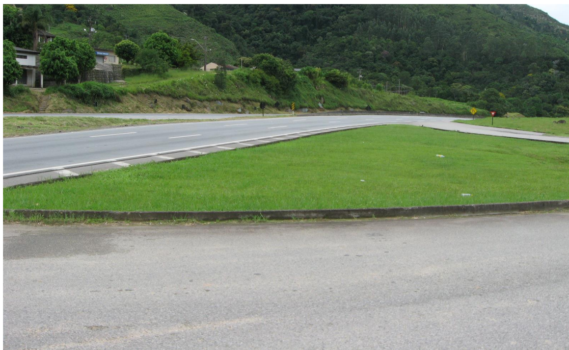
Saída do acesso