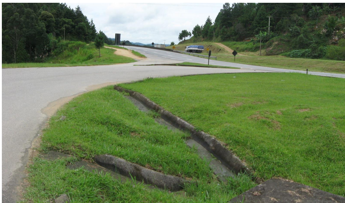
Entrada do acesso

O grande número de pedestres atravessando as pistas representa forte risco de atropelamentos, sendo que está sendo providenciada a construção de uma passarela.