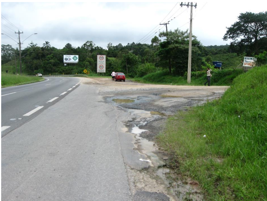
Acesso à estrada da barrinha: bairros Barrinha e Lavras.

O tráfego local conta presença marcante de veículos pesados em virtude dos 2 portos de areia (mais adiante na Estrada Santa Rita existe outro) que se utilizam do acesso.