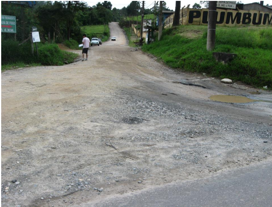
Estrada da Barrinha vista da pista da BR-116