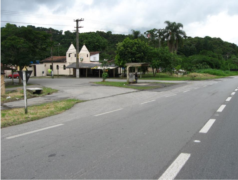
Vista do acesso