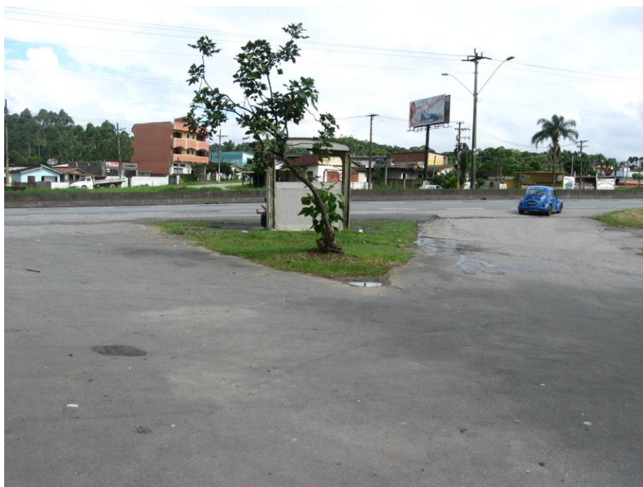
Vista do acesso

O bairro é pequeno e cercado por mata atlântica, apresenta algumas casas de veraneio. Há ainda um grande terreno atualmente vazio que passa por terraplanagem provavelmente para futura expansão do bairro. Existe também um retorno, por viaduto, 200m depois deste acesso.