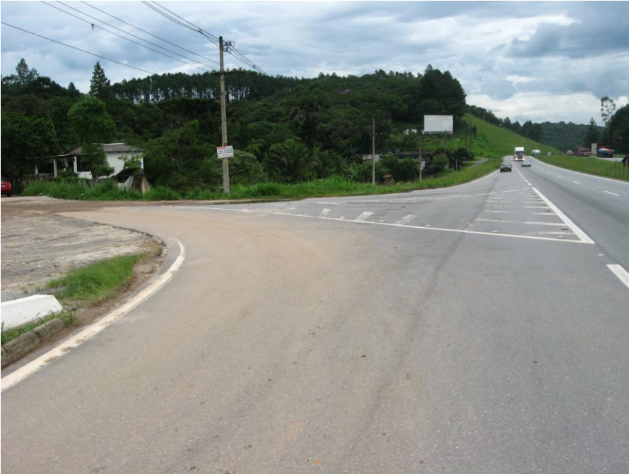
Vista geral do acesso