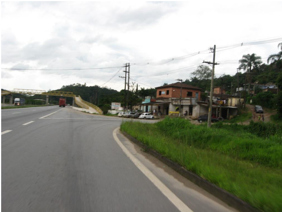
Aproximação do acesso à SP-057

A parte do bairro localizada ao longo da pista norte é bem pequena, constituindo-se de apenas três ruas alongadas e paralelas à rodovia, com aproximadamente 30 residências modestas além da empresa de parafusos Bemfixa, já na margem da rodovia. É neste lado que se acessa a SP-57 – Estrada do Jacuba, que dá acesso ao parque aquático Viva Waterpark Fantasy, além de algumas casas isoladas por trechos de mata, sítios com pequenas horticulturas e casas de campo de alto padrão.