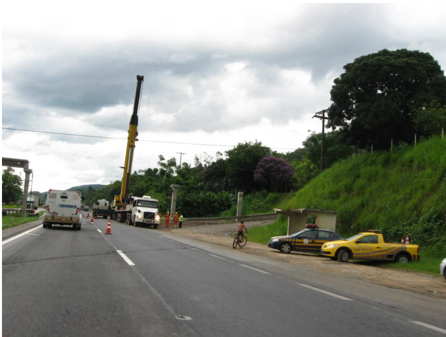
Aproximação do acesso: ponto de ônibus e construção da passarela de pedestres.

Neste local inicia-se uma série de estradas de terra que se subdividem e avançam pelo interior do município, subindo e contornando a serra ali existente. Nestas estradas, observa-se alguns lagos, sítios com pequenas casas, e extensos bananais.