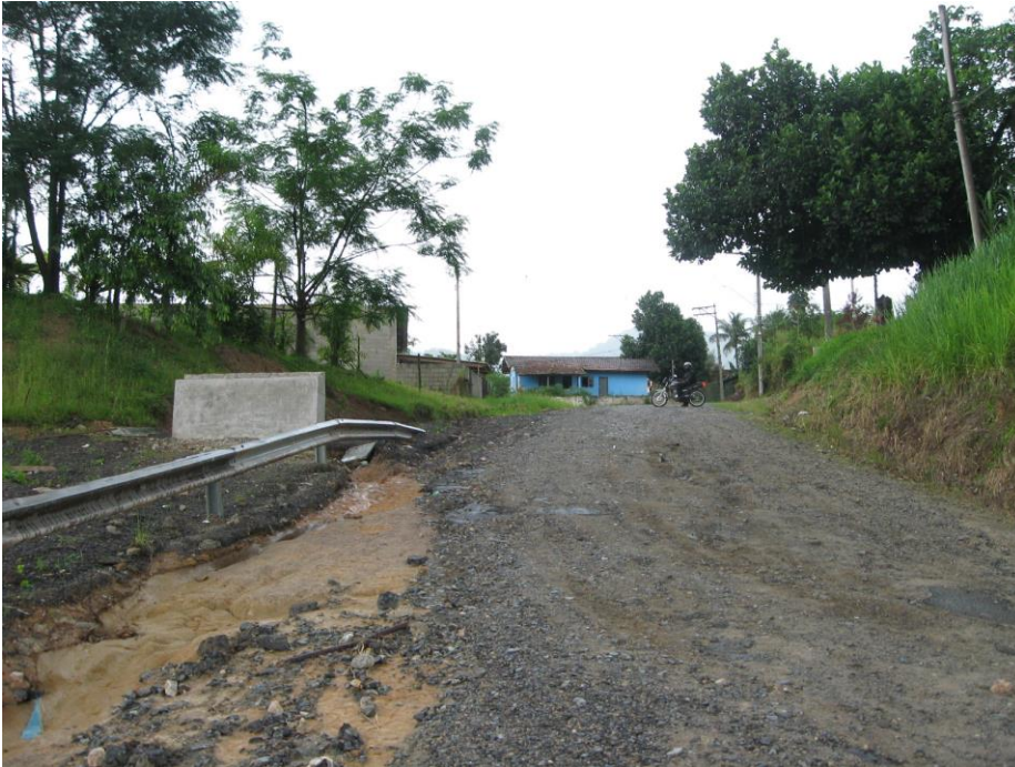
Vista do acesso a partir da rodovia.