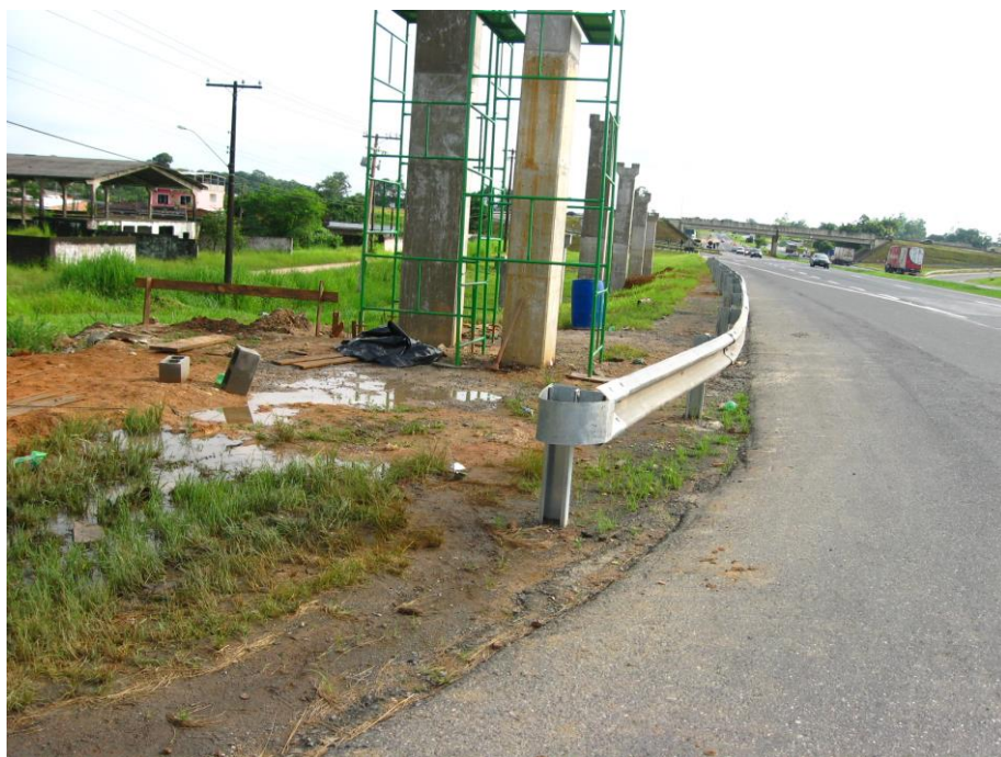
Vista da aproximação do acesso

No bairro existe uma escola estadual de ensino infantil, fundamental e médio (E. E. JOSÉ PACHECO LOMBA), escola de ensino técnico (SENAR), um posto de saúde (Unidade de Posto de Saúde da Família IV), creches e uma empresa de Agroindústria (ARATEA Agroindústria e Reflorestamento). A seguir fotos do acesso pela pista Sul.