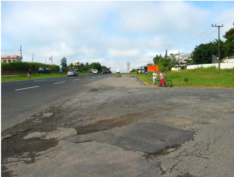
Vista da saída do acesso