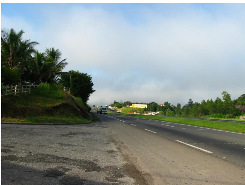
Vista da saída, com acesso particular em seguida

No bairro existe uma escola estadual de ensino infantil, fundamental e médio (E. E. JOSÉ PACHECO LOMBA), escola de ensino técnico (SENAR), um posto de saúde (Unidade de Posto de Saúde da Família IV), creches e uma empresa de Agroindústria (ARATEA Agroindústria e Reflorestamento). A seguir fotos do acesso pela pista Norte.