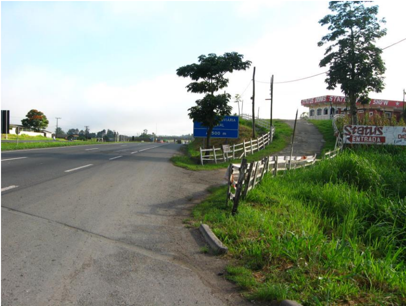
Vista da saída, com acesso particular em seguida