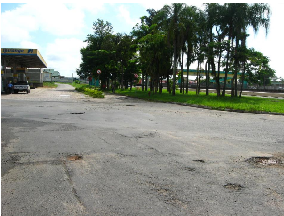
Vista no sentido sul-norte – posto de combustível

O movimento no sentido sul-norte da referida marginal não dispõe de visibilidade adequada para cruzar a rua José Antonio de Campos e atingir o posto de combustível existente, com presença significativa de veículos pesados.