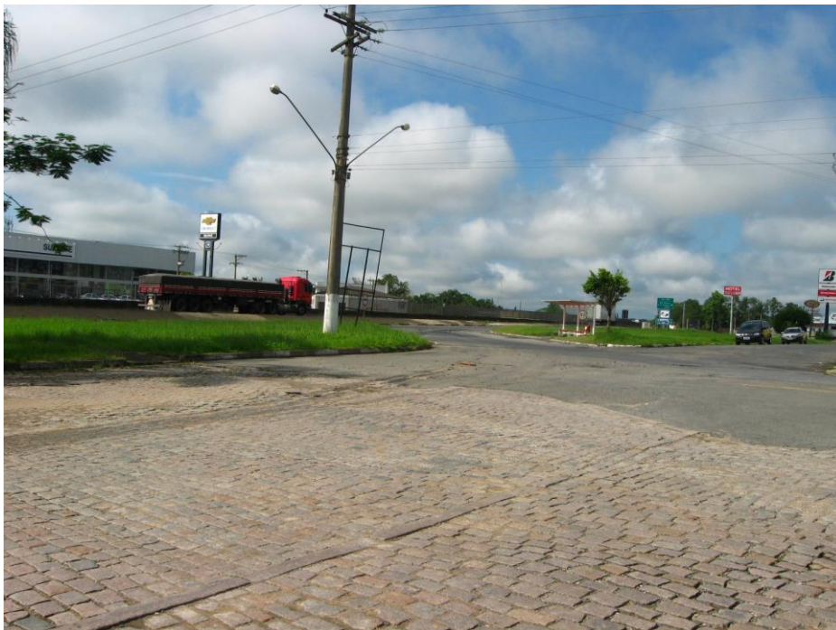
Vista no sentido norte-sul – dispositivo de acesso