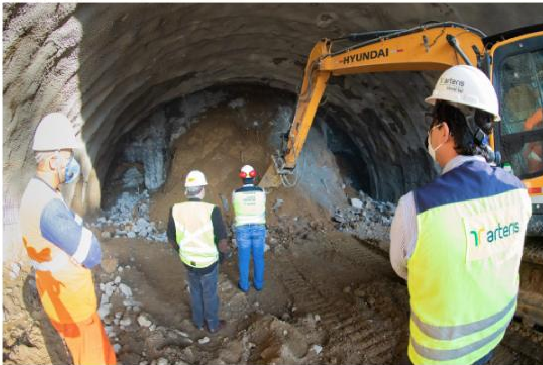
Presidente da FIESC visitou escavações subterrâneas