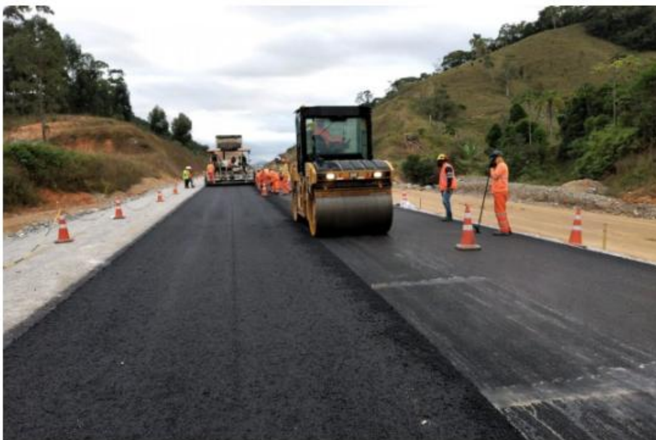
Pavimentação avança nos trechos Norte e Intermediário

Para saber mais sobre o andamento em todos os trechos, clique aqui para acessar o relatório.