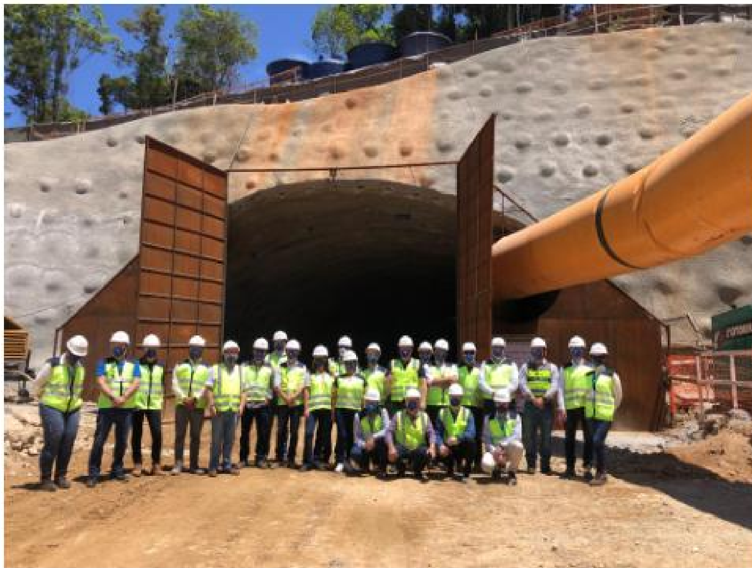
Após a reunião, representantes do grupo visitaram pontos importantes da obra