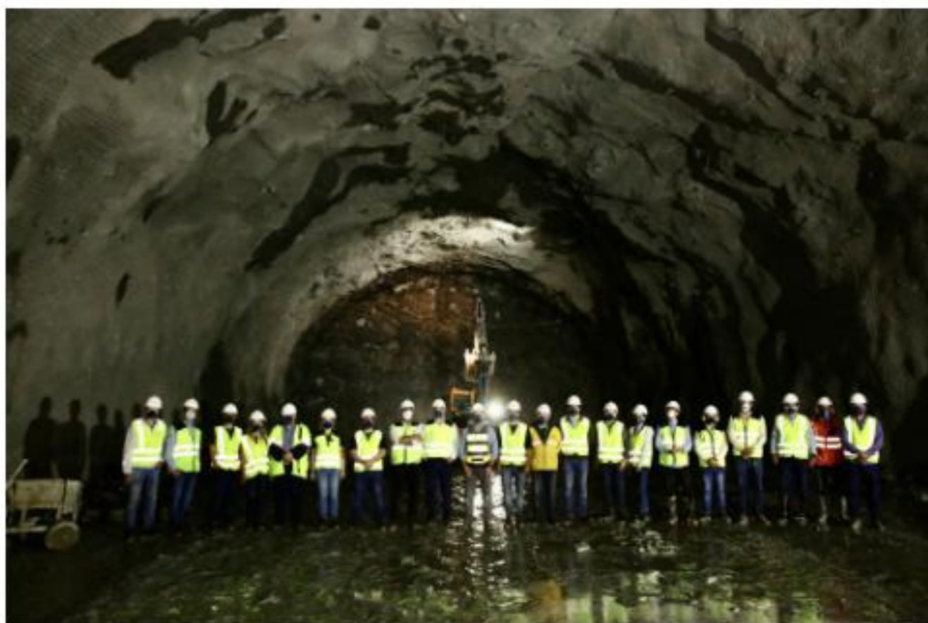
Membros do órgão regulador foram recebidos pela diretoria da Arteris