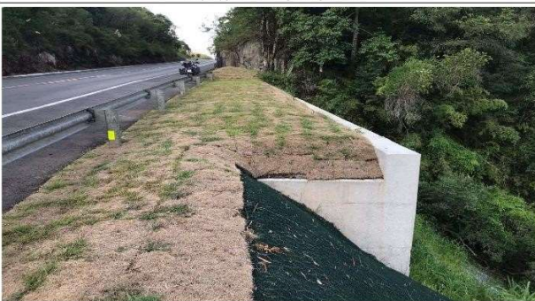
FASE 10 - OBRA CONCLUIDA