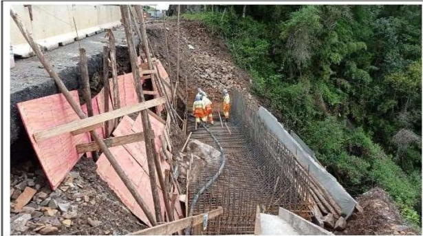
FASE 04 - LAJE DO MURO - DURANTE