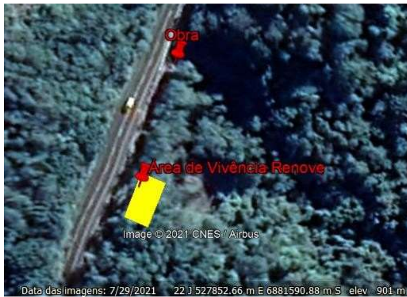
Figura 1: Localização da obra e área de vivência.