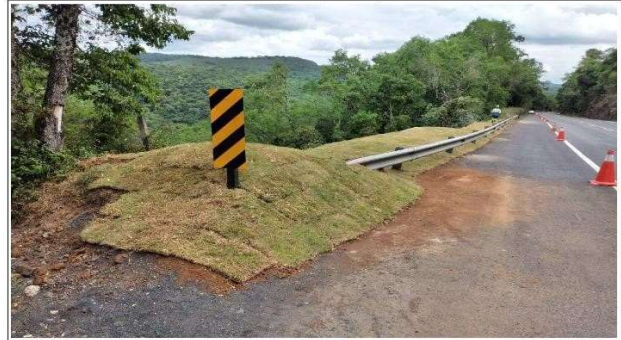
FASE 09 - PLANTIO DE GRAMA