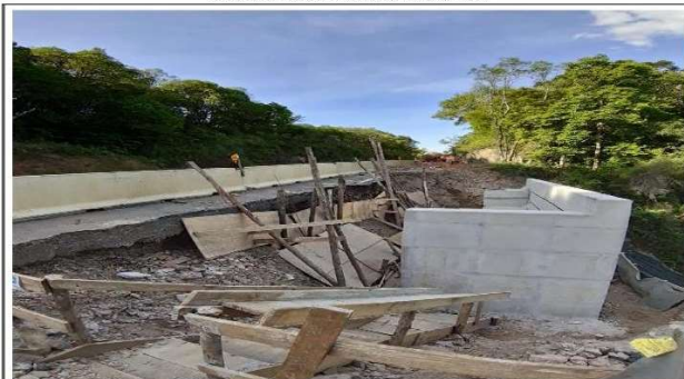
FASE 04 - MURO