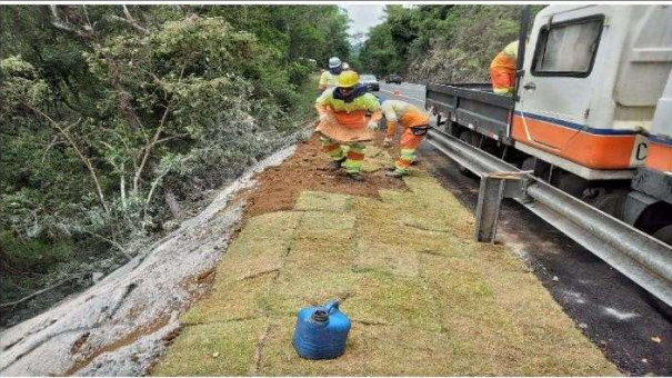
FASE 09 - PLANTIO DE GRAMA