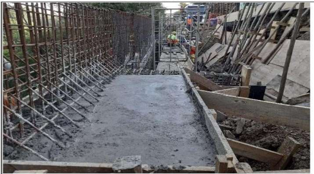
FASE 04 - LAJE DO MURO - DURANTE