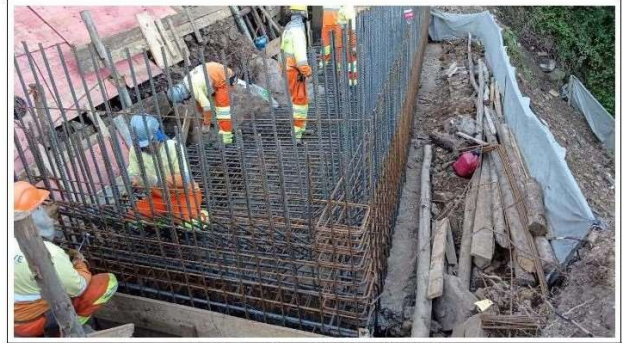
FASE 04 - LAJE DO MURO - DURANTE