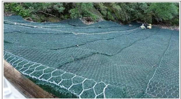
FASE 05 - APLICAÇÃO TELA