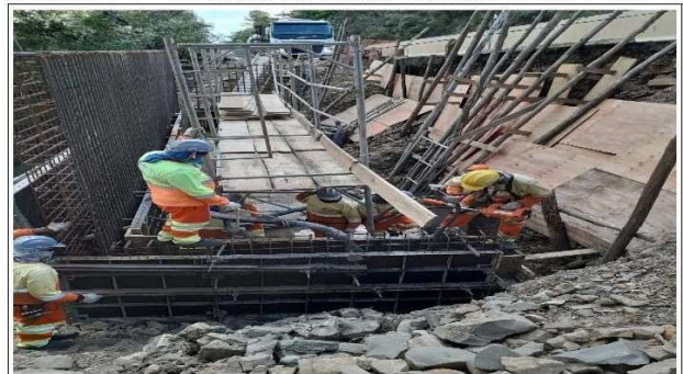
FASE 04 - MURO