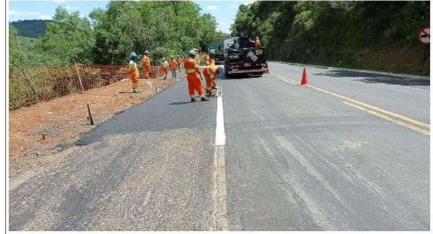
FASE 08 - PAVIMENTAÇÃO