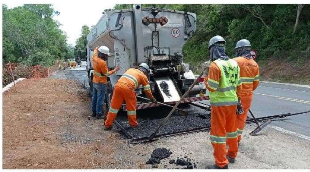
FASE 08 - PAVIMENTAÇÃO