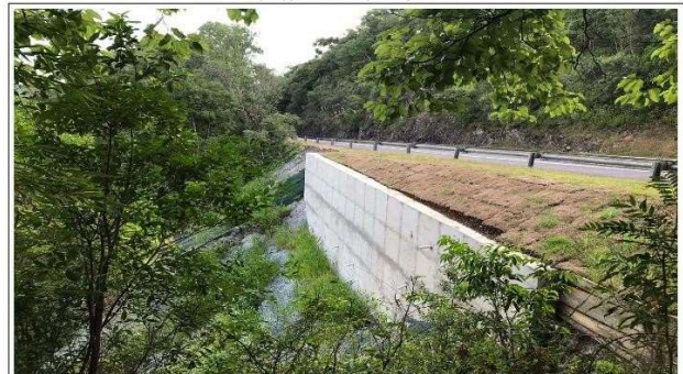
FASE 10 - OBRA CONCLUIDA