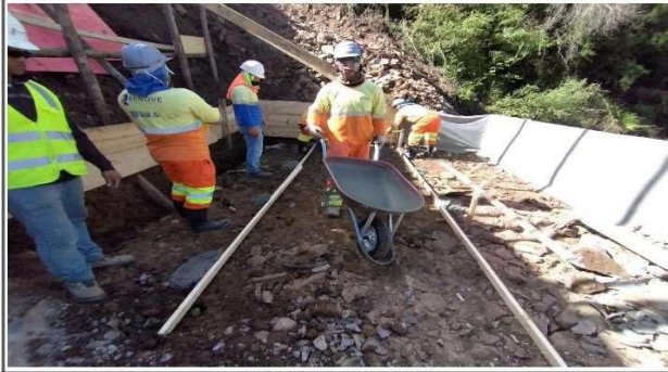
FASE 04 - LAJE DO MURO