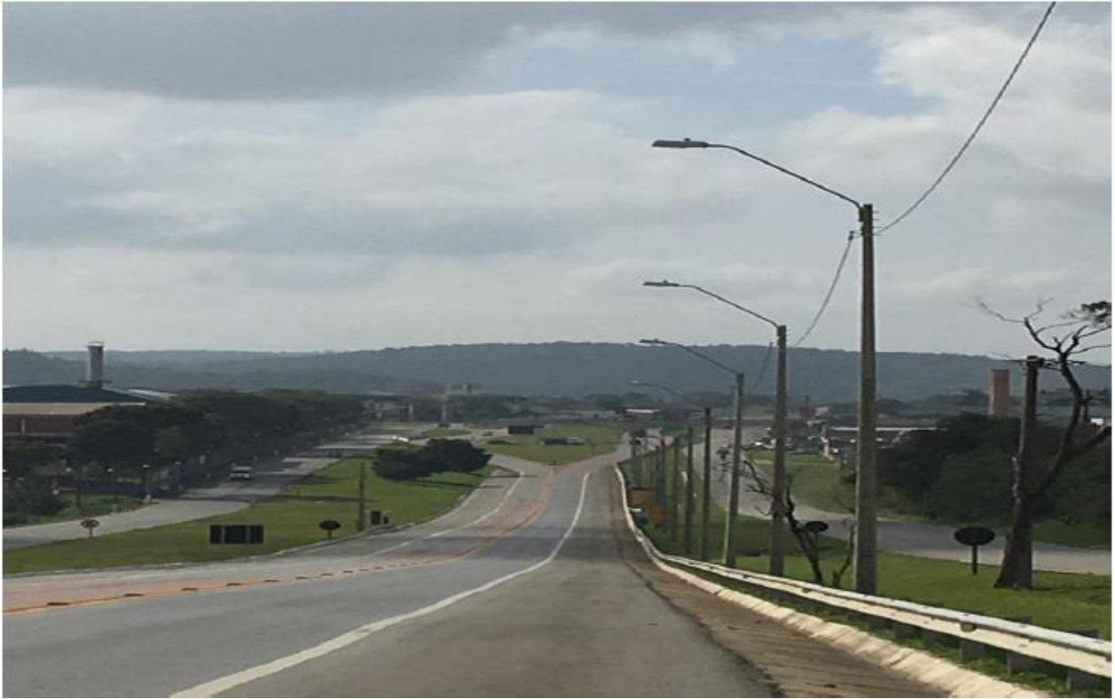
Figura 6 - Vista Geral da Obra