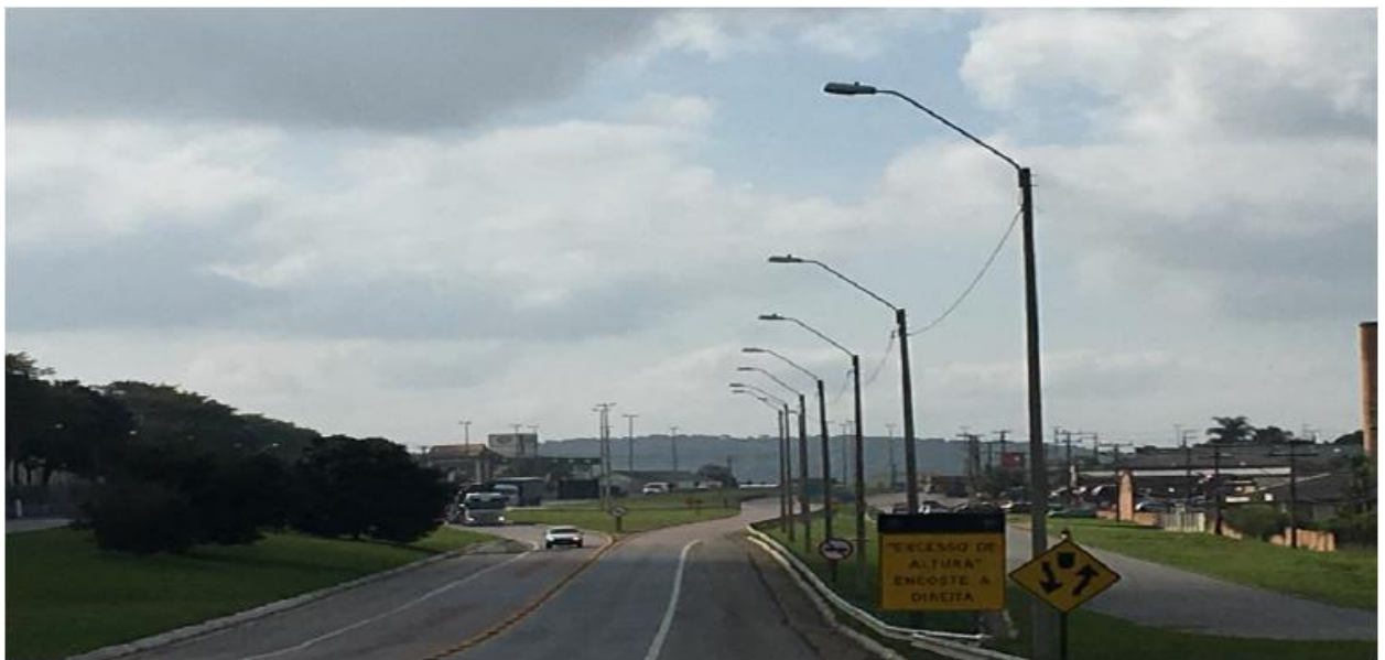
Figura 7 - Vista Geral da Obra