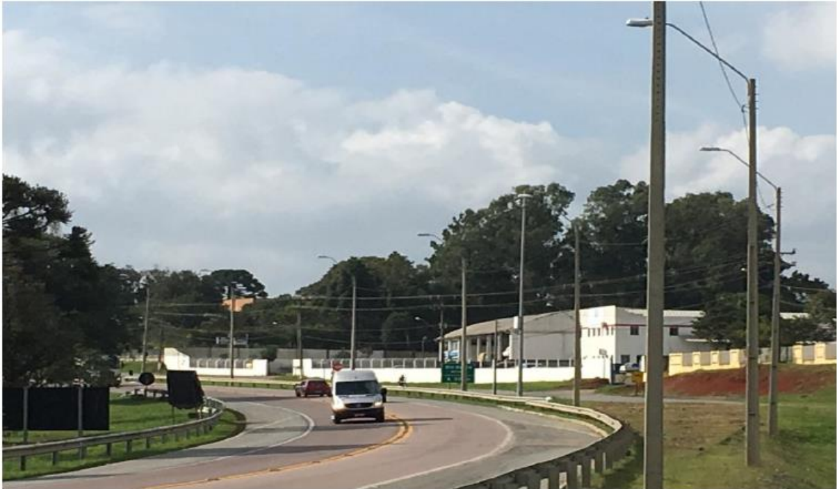
Figura 4 - Vista Geral da Obra