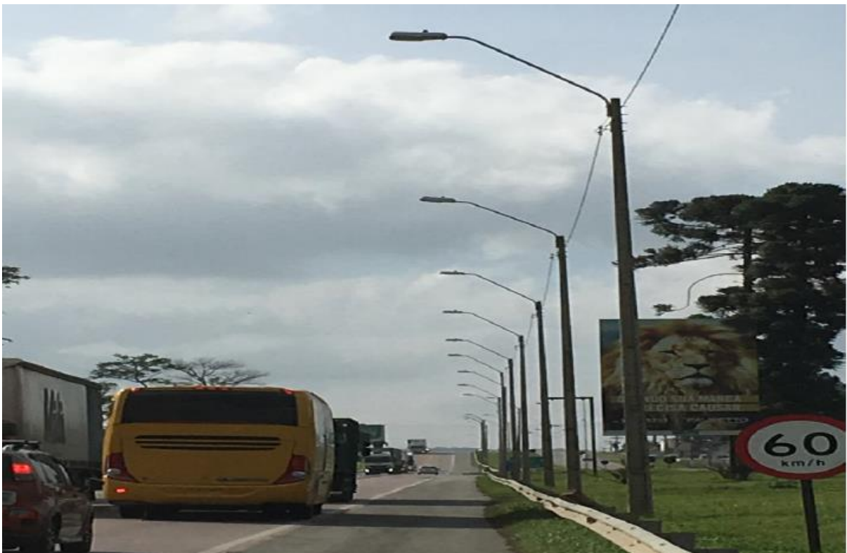
Figura 5 - Vista Geral da Obra