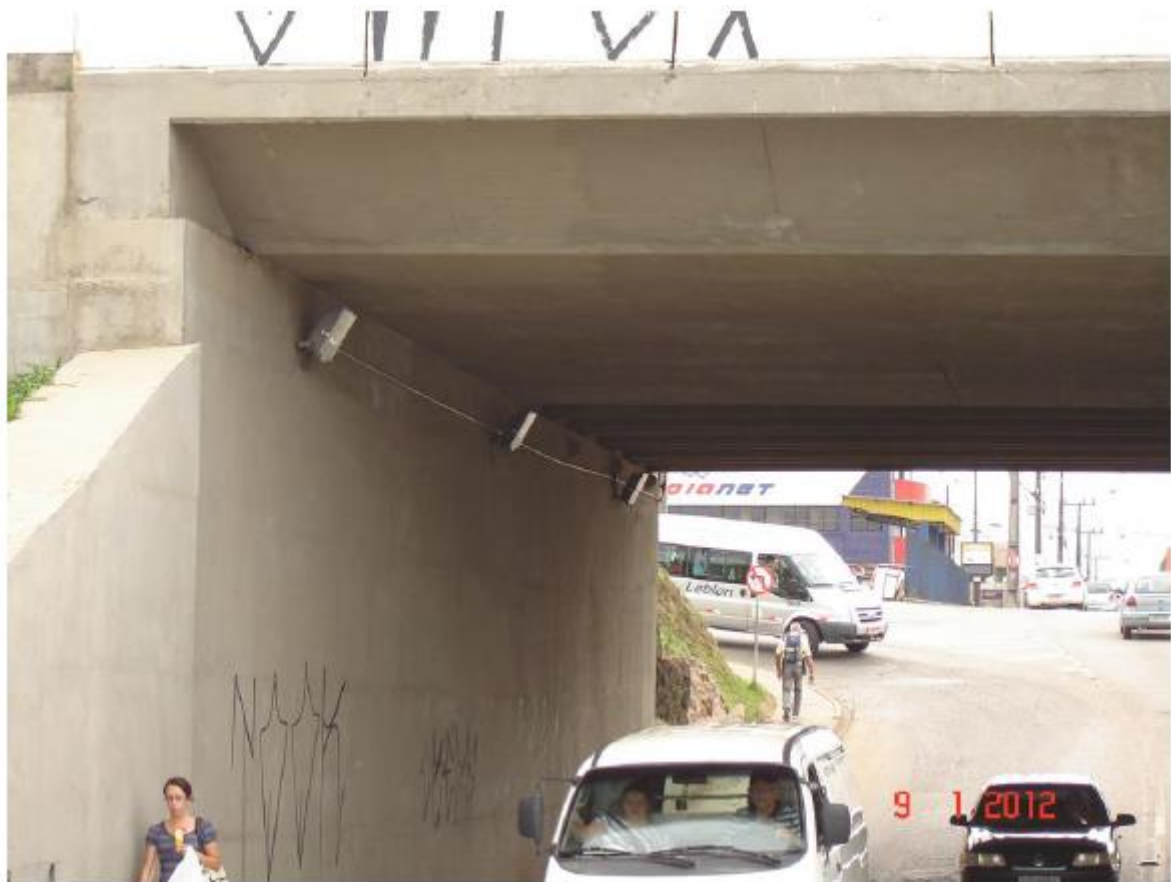
Figura 3 - Vista das Instalações de Iluminação