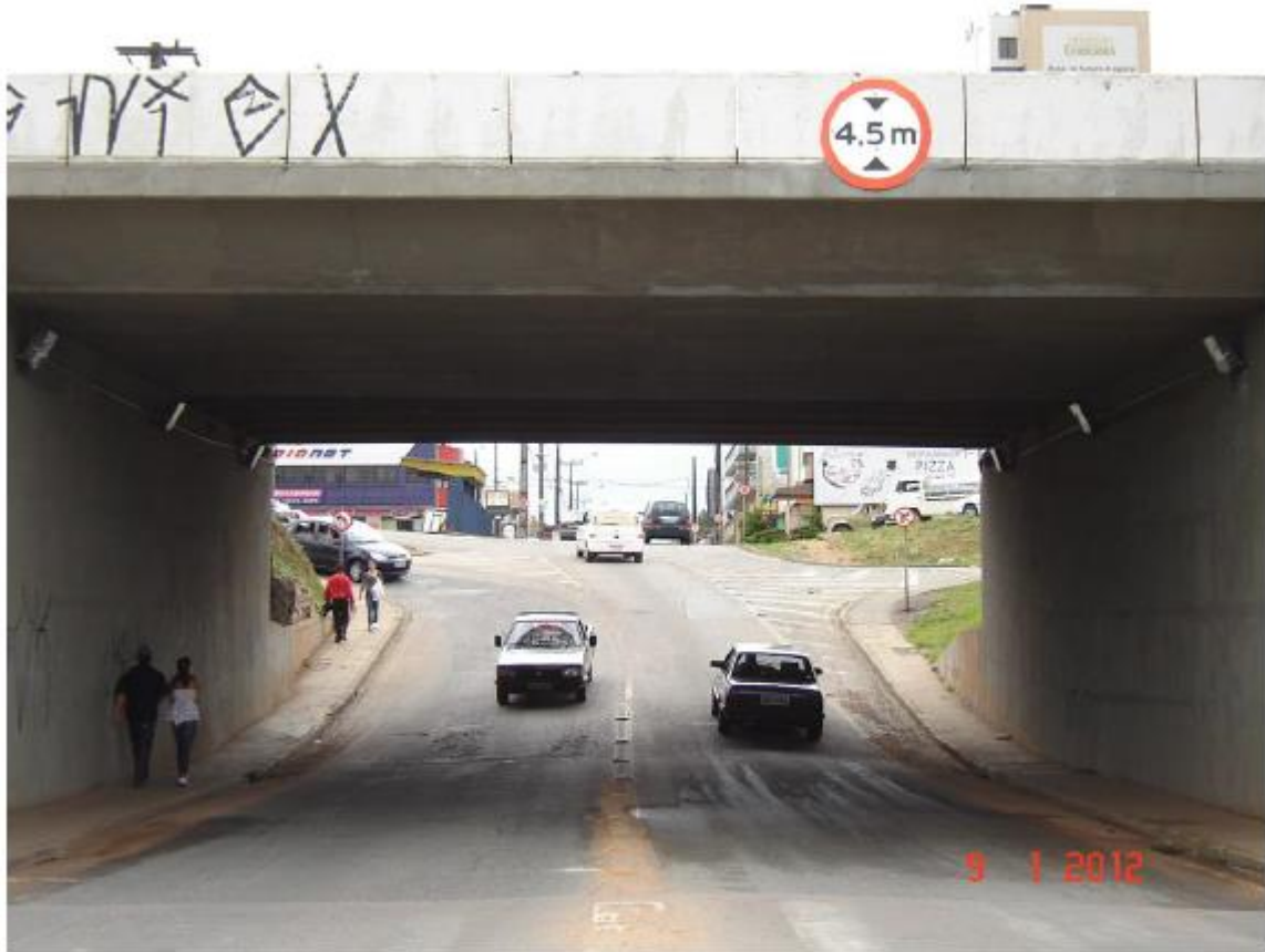
Figura 1 - Vista Geral da Iluminação Instalada