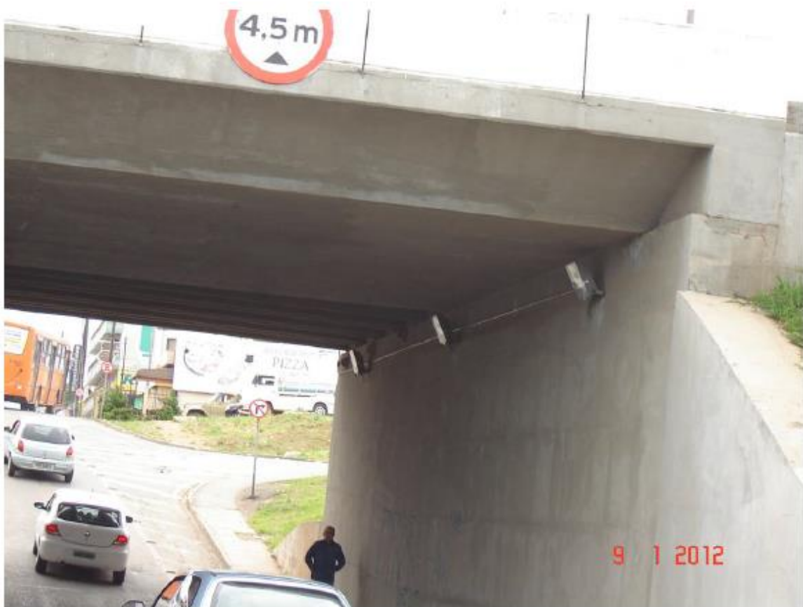
Figura 2 - Vista das Instalações de Iluminação