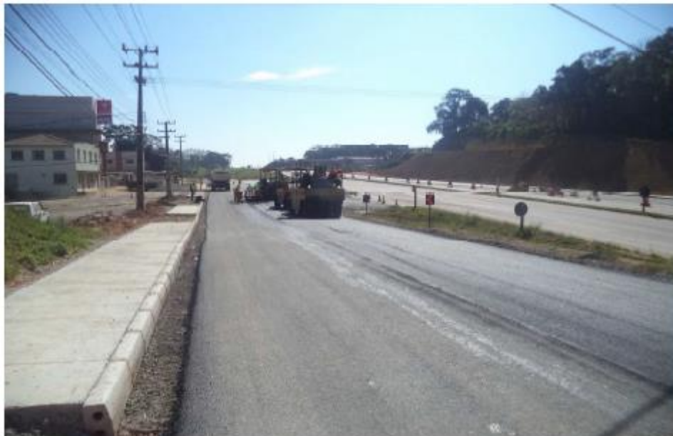
Figura 8 - Pavimentação na RL Sul