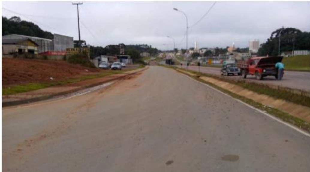
Figura 17 - Vista Geral da Estaca 28+0,00