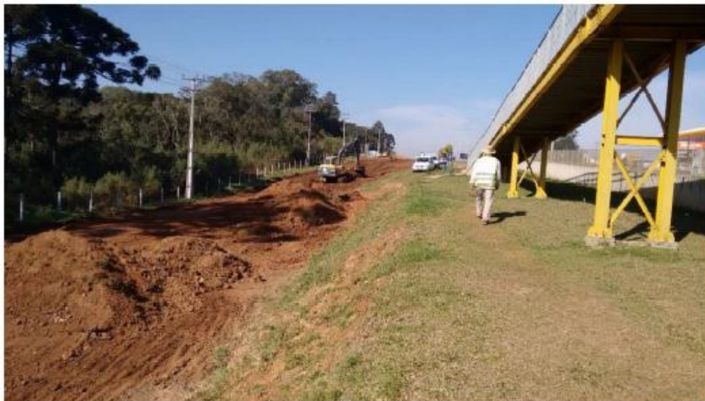
Figura 27 - Serviços Preliminares