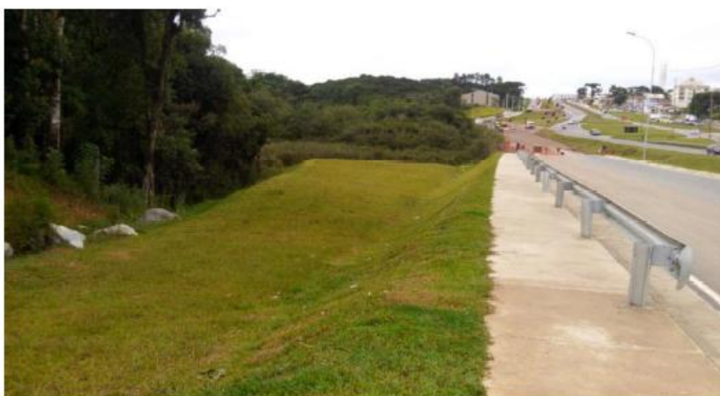
Figura 14 - Vista Geral da Estaca 17+0,00