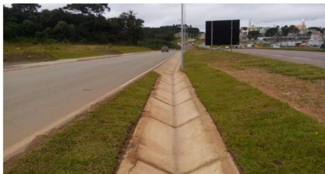
Figura 15 - Transição entre as Canaletas SCC-01 e STC-01