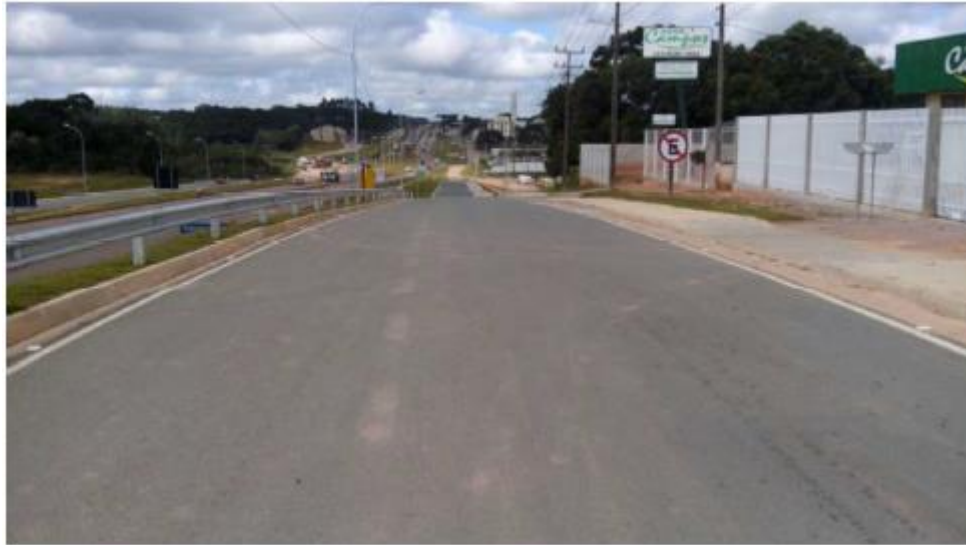
Figura 25 - Vista Geral da Obra