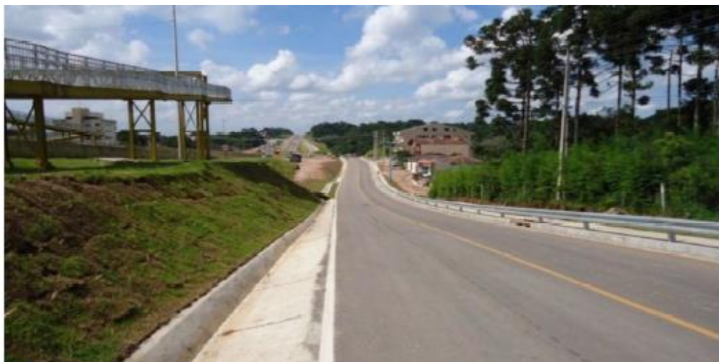
Figura 36 - Vista Geral da Obra