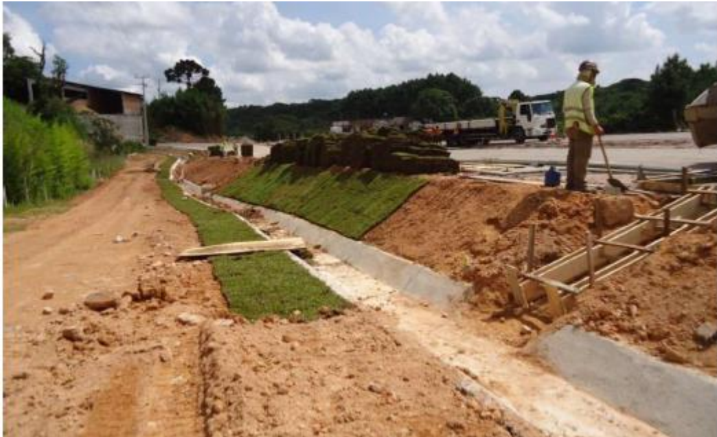
Figura 35 - Serviços Complementares