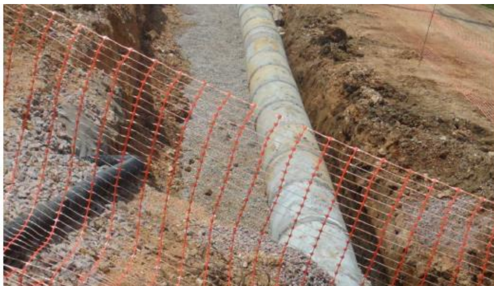
Figura 31 - Execução de Drenagem e Obra de Arte Corrente