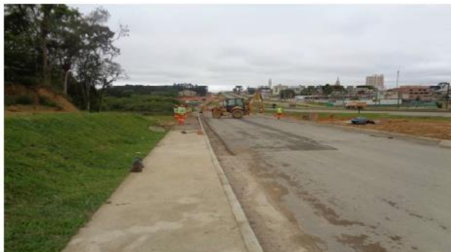
Figura 11 - Serviços Complementares na RL Norte