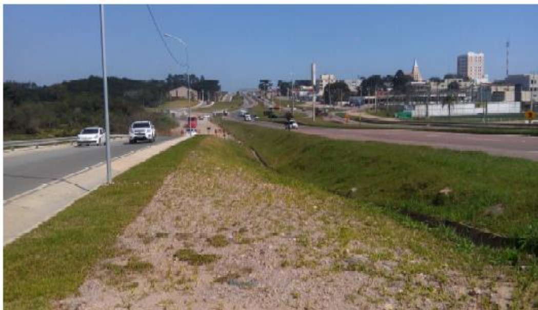
Figura 13 - Vista Geral da Estaca 15+4,38