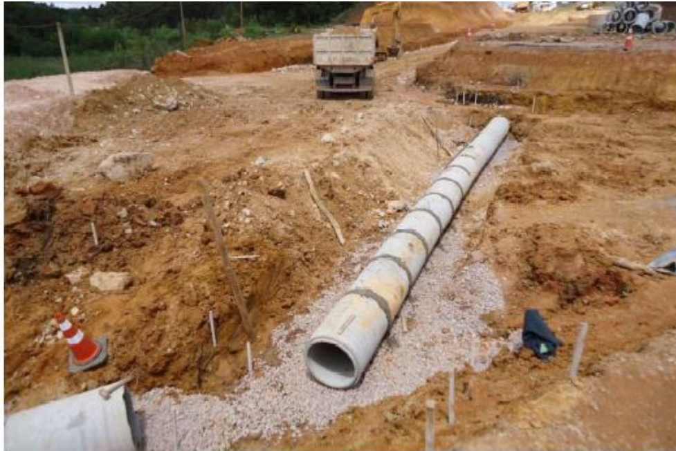
Figura 30 - Execução de Drenagem e Obra de Arte Corrente