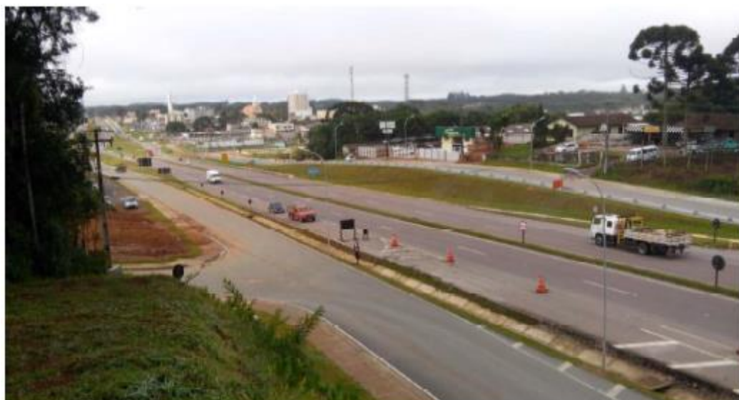
Figura 18 - Vista Geral da Obra