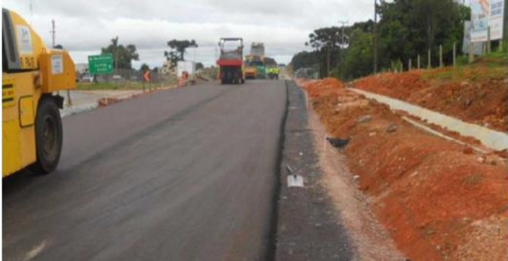
Figura 32 - Execução de Pavimento