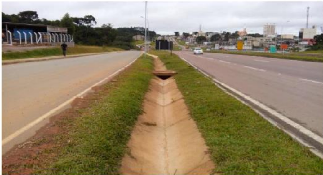
Figura 16 - Caixa Coletora na Estaca 23+0,00