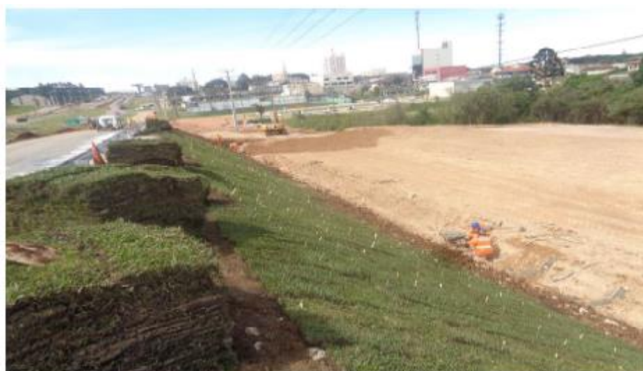
Figura 12 - Serviços Complementares na RL Sul