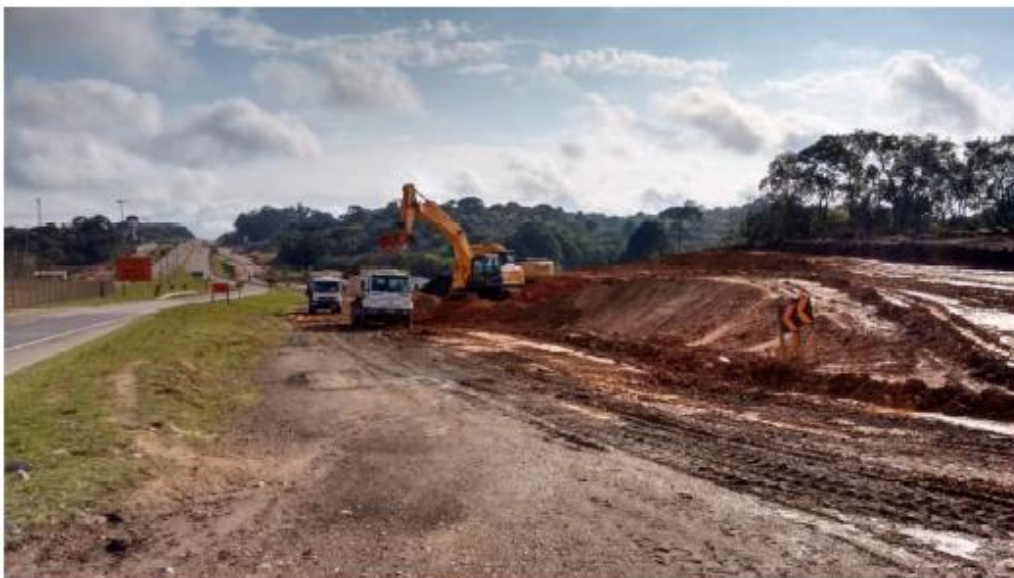
Figura 28 - Execução de Terraplenagem