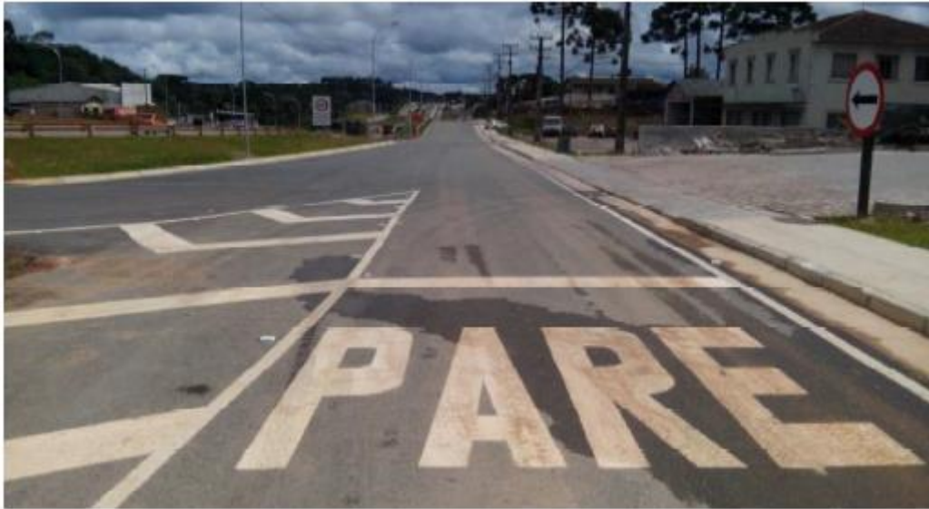
Figura 19 - Vista Geral da Estaca 12+12,0