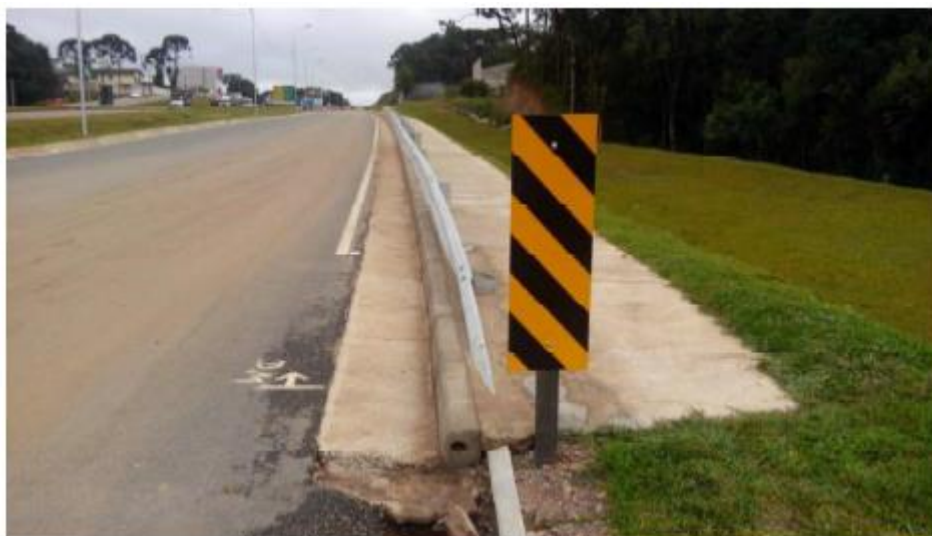
Figura 9 - Sinalização na RL Norte