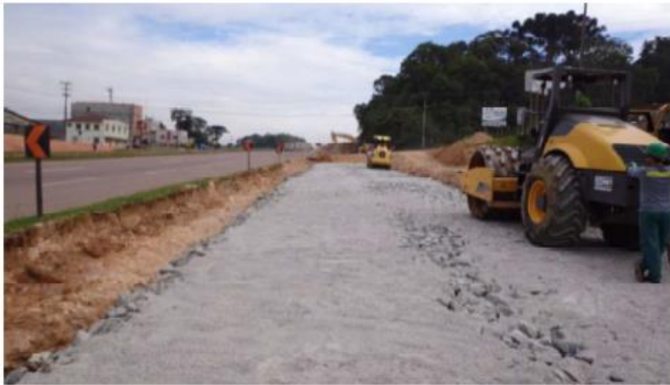
Figura 7 - Pavimentação na RL Norte