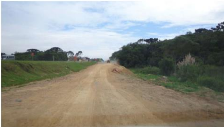
Figura 1 - Serviços Preliminares na RL Norte