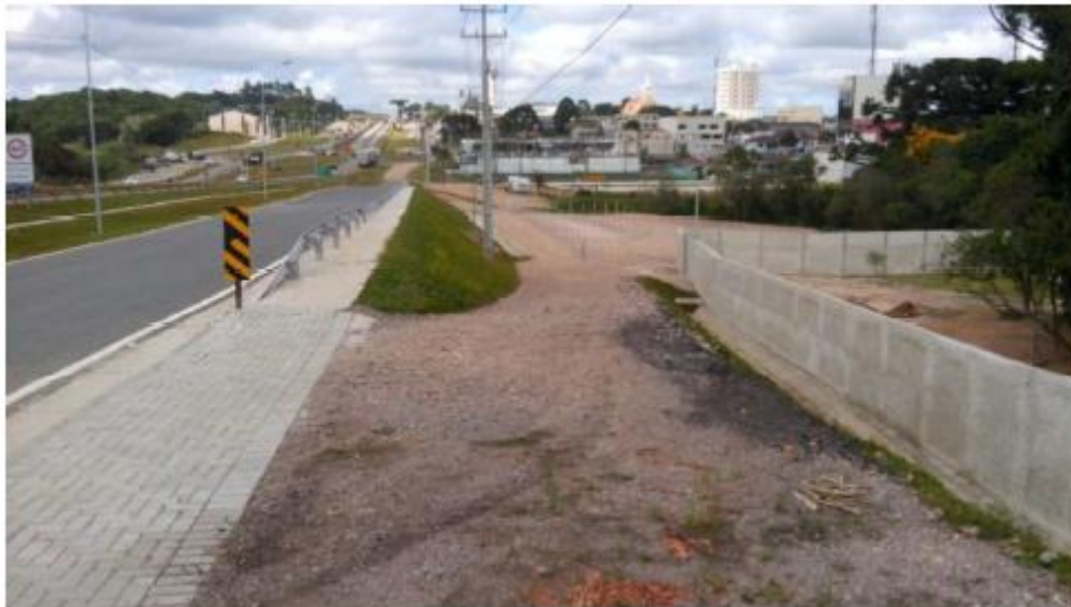
Figura 23 - Vista Geral da Estaca 26+0,00