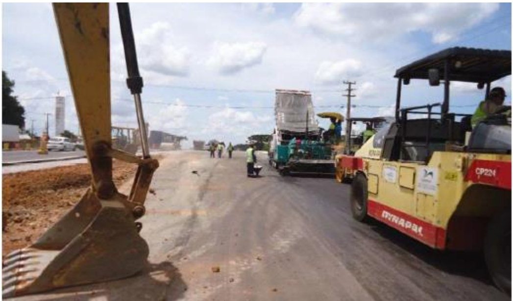
Figura 33 - Execução de Pavimento