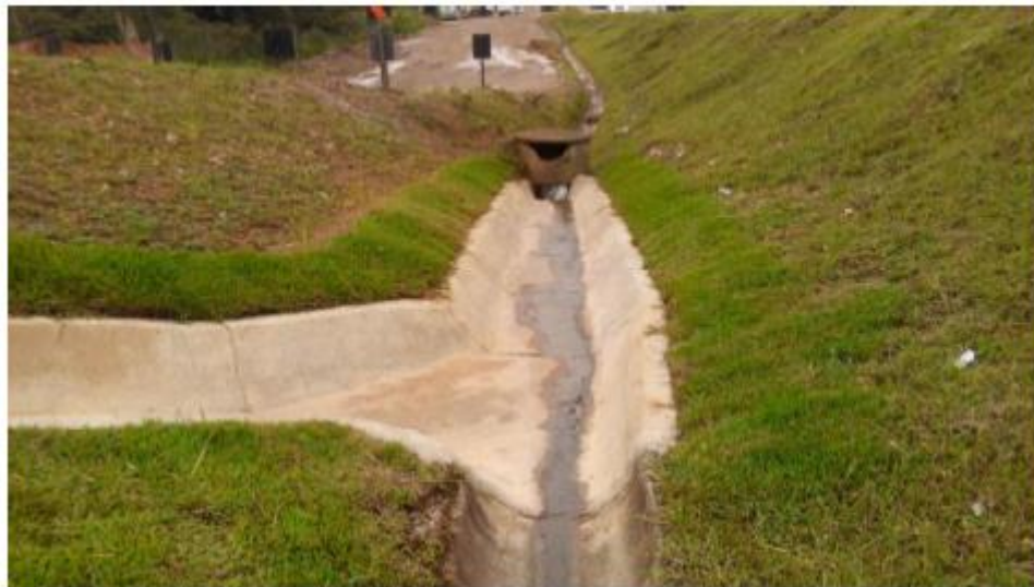
Figura 5 - Drenagem Superficial na RL Norte