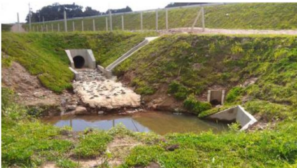
Figura 24 - Drenagem na Estaca 32+10,00