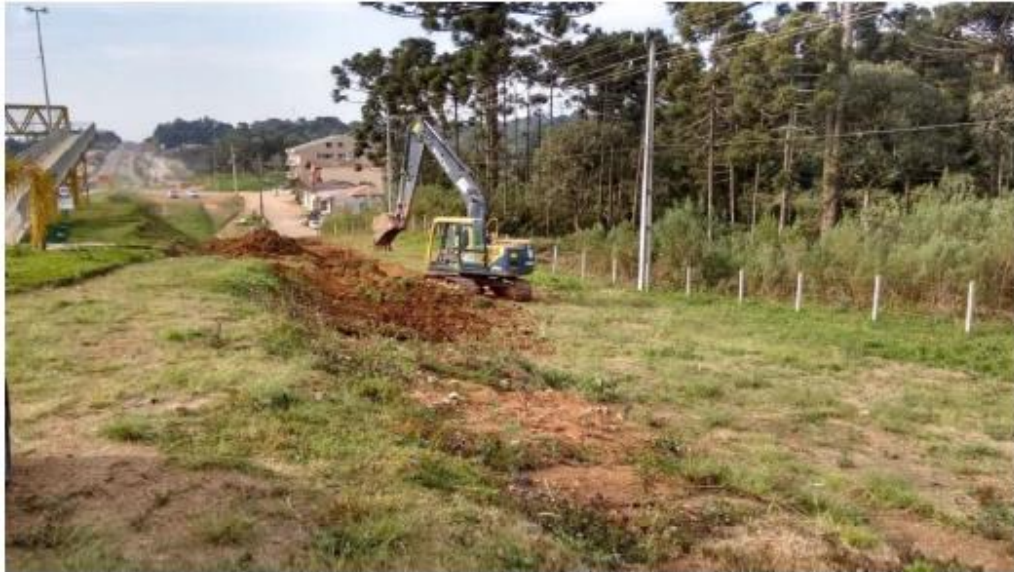
Figura 26 - Serviços Preliminares