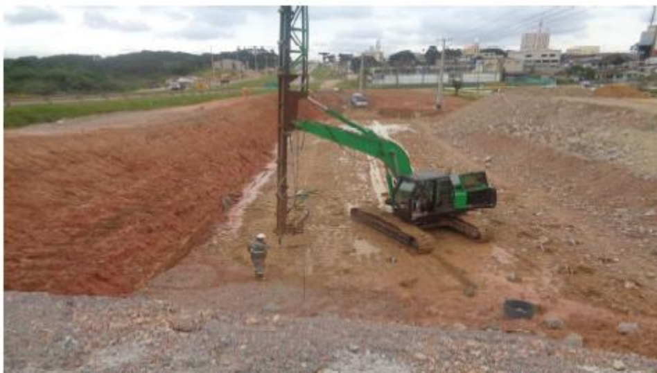
Figura 6 - Drenagem na RL Sul