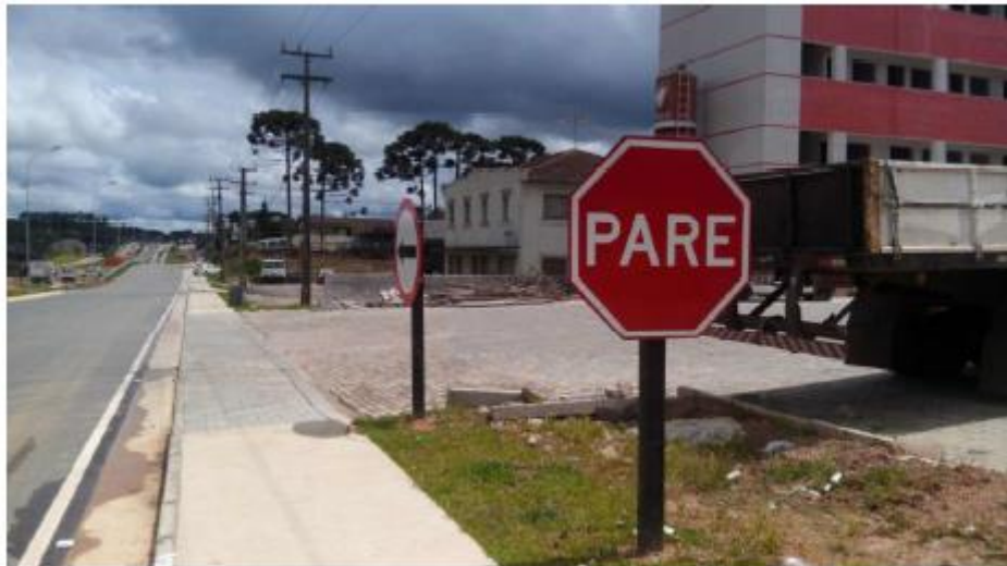
Figura 10 - Sinalização na RL Sul