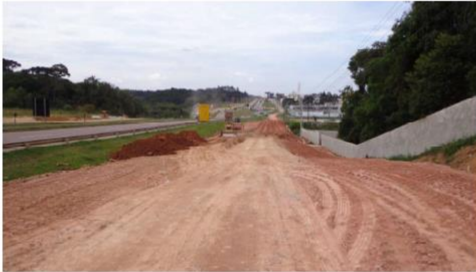
Figura 4 - Terraplenagem na RL Sul