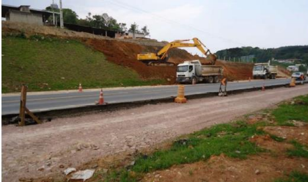
Figura 29 - Execução de Terraplenagem