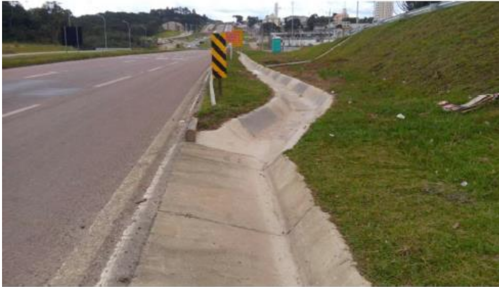
Figura 22 - Transição entre Canaletas STC-01 e VPA-04