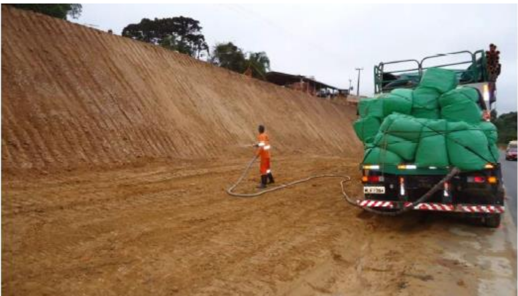
Figura 34 - Serviços Complementares