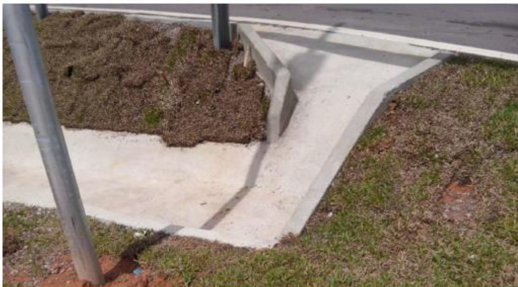
Figura 20 - Drenagem na Estaca 12+0,00