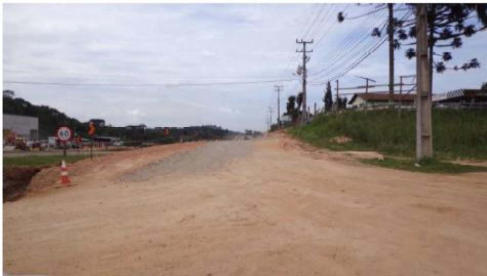
Figura 2 - Serviços Preliminares na RL Sul