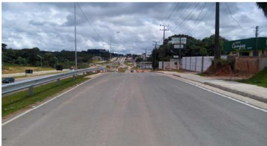
Figura 21 - Vista do Pavimento na Estaca 18+0,00