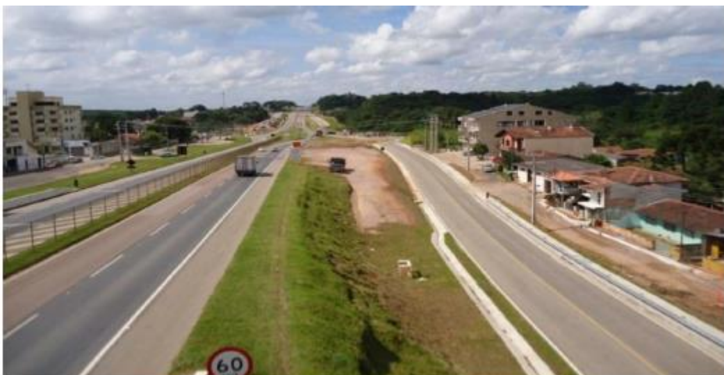
Figura 37 - Vista Geral da Obra