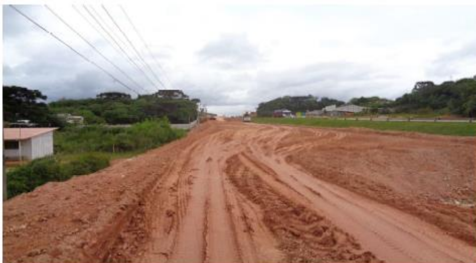
Figura 3 - Terraplenagem na RL Norte